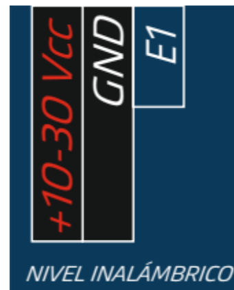
Figura 2. Imagen de la bornera de entradas de la unidad central

La entrada E1 está destinada a la colocación de una boya electrónica o un pulsador (sólo para las opciones de funcionamiento 2 y 3 detallados posteriormente).