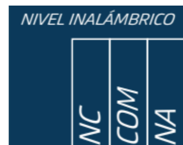
Figura 3. Imagen de la bornera de salidas de la unidad central

En la figura 4 se muestra el esquema de los contactos de salida.