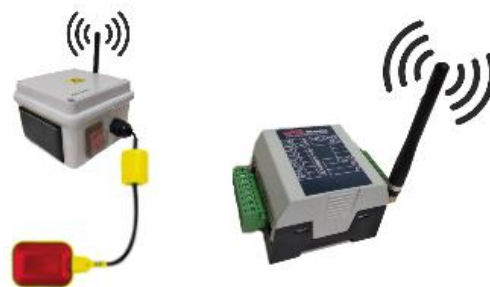
Figura 1. Unidad central a la derecha y nivel a la izquierda.